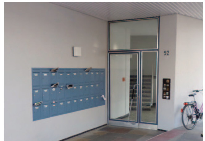
Auch die Belange der Mieter werden bei der Sanierung berücksichtigt.