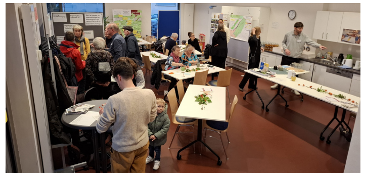
Tag der Bürgerinformation im November 2025

nagement werden auch Mitarbeiterinnen und Mitarbeiter der Fachabteilungen der Stadt Stuttgart vor Ort sein. Der nächste Termin wird dann über die üblichen Kanäle bekannt gegeben (Homepage, E-Mail-Verteiler, Aushänge am Bürgertreff).