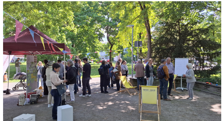
Beteiligungstag am 9.5.2025 in der Klingenbachanlage

lich dokumentiert und bilden die Grundlage für eine gemeinsame Ausschreibung, die für das Jahr 2026 vorgesehen ist. Derzeit laufen verschiedene Untersuchungen und Gutachten, darunter eine Kampfmitteluntersuchung, Vermessungen, ein Artenschutzgutachten, ein Überflutungsnachweis sowie ein Altlastengutachten. Sobald eine erste Vorplanung vorliegt, kann dieser in der Öffentlichkeit gezeigt werden, sowohl in Gablenberg als auch in Gaisburg.